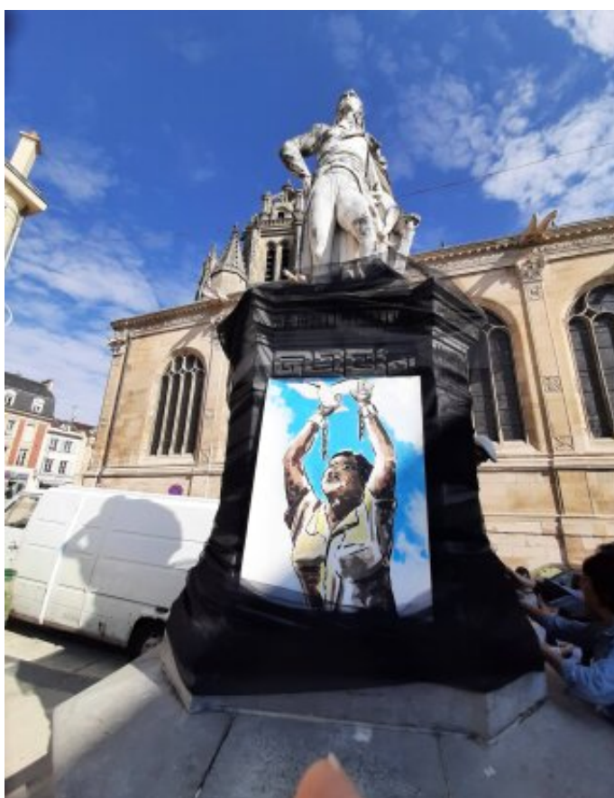
La statue du général Leclerc, génocidaire d'Haïti, rhabillée lors d'un rassemblement de protestation