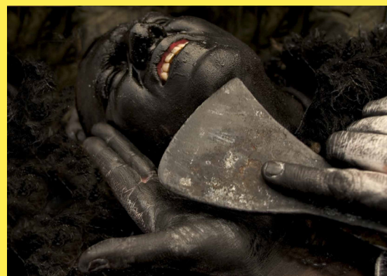
Rasage de l'ours à la fête des Ours en Vallespir, Prats de Mollo, s. d.