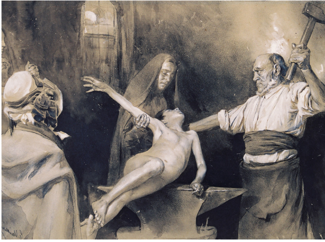
Gaston Vuillier Le martelage de la rate , 1899. Dessin au crayon graphite et à l'aquarelle noire avec des rehauts de gouache blanche sur papier vélin collé sur carton, 27 x 44 cm. Reproduction musée du Cloître, Ville de Tulle.