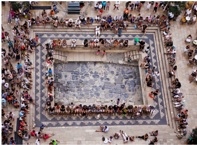
La Via Domitia, mise au jour par les archéologues en 1997, place de l'Hôtel de Ville à Narbonne.