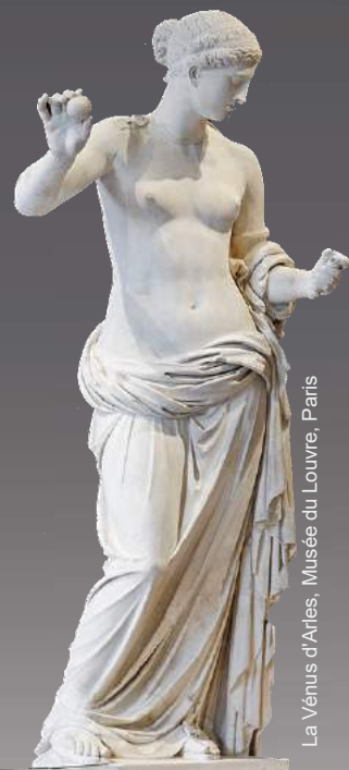
La Vénus d'Arles, Musée du Louvre, Paris