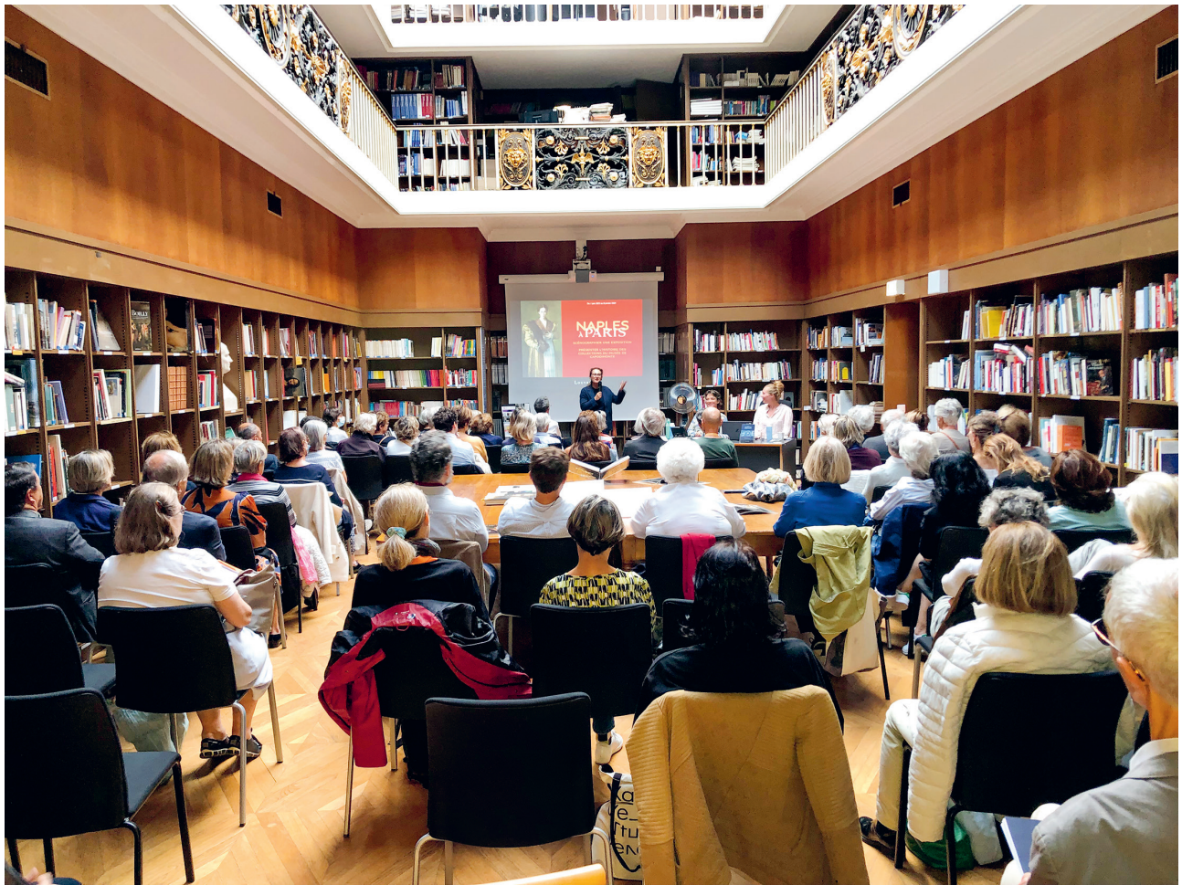
Centre Dominique-Vivant Denon

Journée du 11 décembre ouverte au public, Centre Dominique-Vivant Denon. Inscription obligatoire à centre-vivant-denon@louvre.fr . Les inscrits sont priés de se présenter munis de leur carte d'identité.