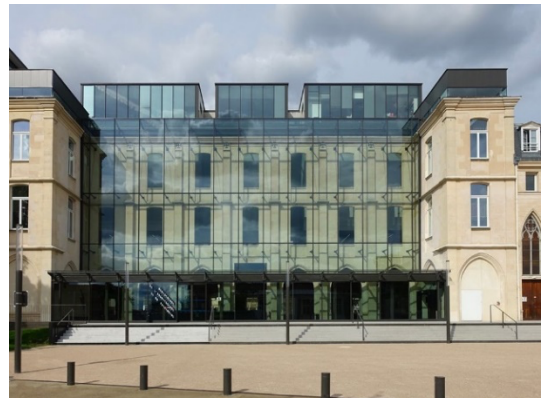
Entrée de la Médiathèque de l'architecture et du patrimoine, Charenton-le-Pont

Médiathèque du Patrimoine et de l'Architecture : 11 Rue du Séminaire de Conflans 220, 94220 Charenton-le-Pont.